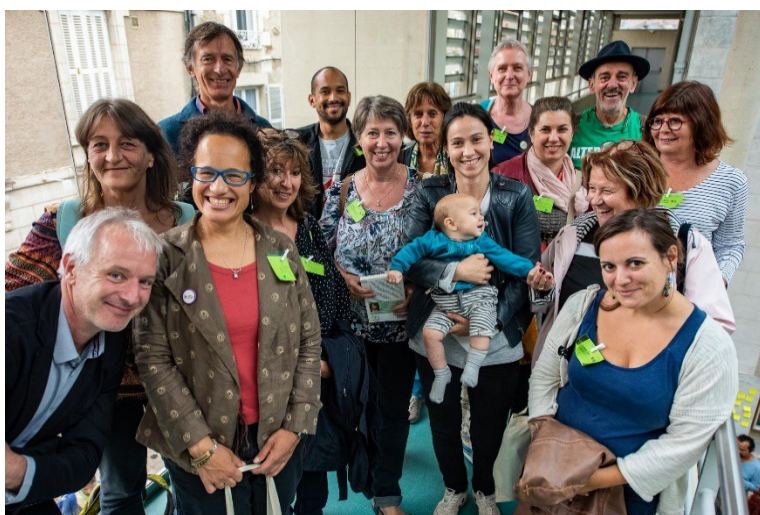
Les citoyens de la Région Centre à la rentrée des initiatives citoyennes

Le colloque s'est terminé par le discours de l'élu à l'élection sans candidat : un discours très humoristique, festif et qui a entraîné les participants dans une liesse partagée, en musique.